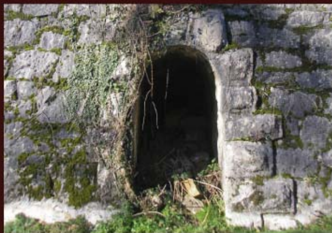
Detalle de una de las embocaduras que comunicaban con lastolvas interiores del depósito.