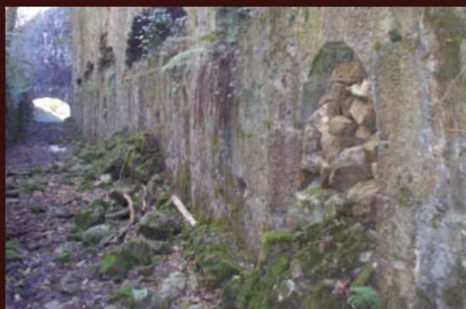
Aspecto interior del depósito.