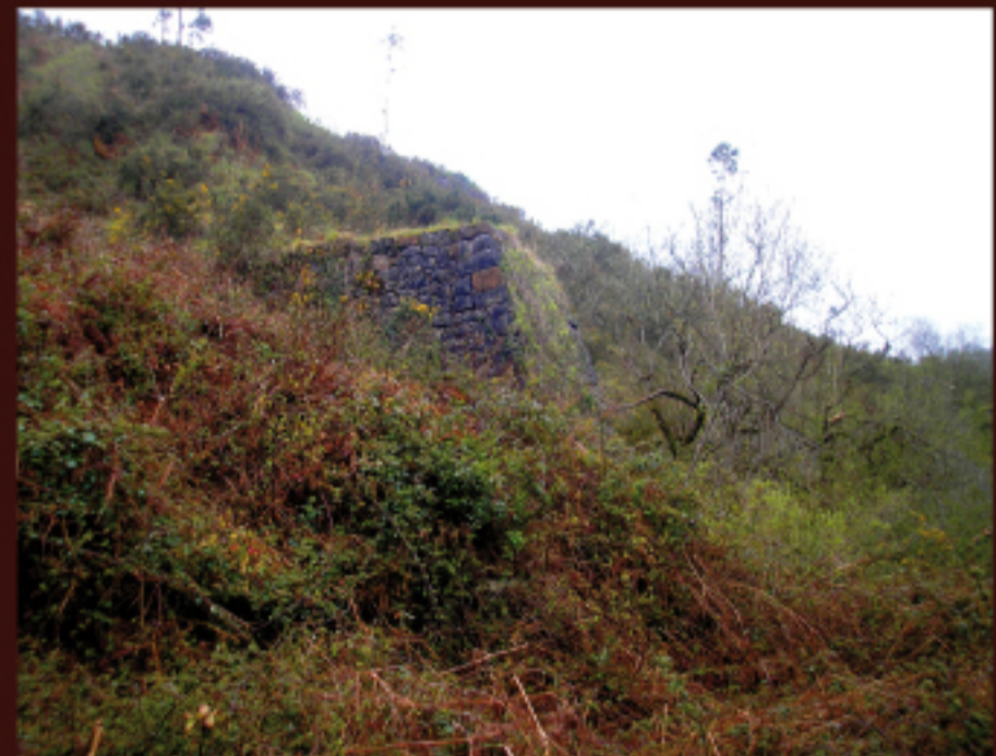
En el centro de la imagen cabeza de plano inclinado construido en sillarejo que se encuentra en el interior de la corta de La Ceferina.