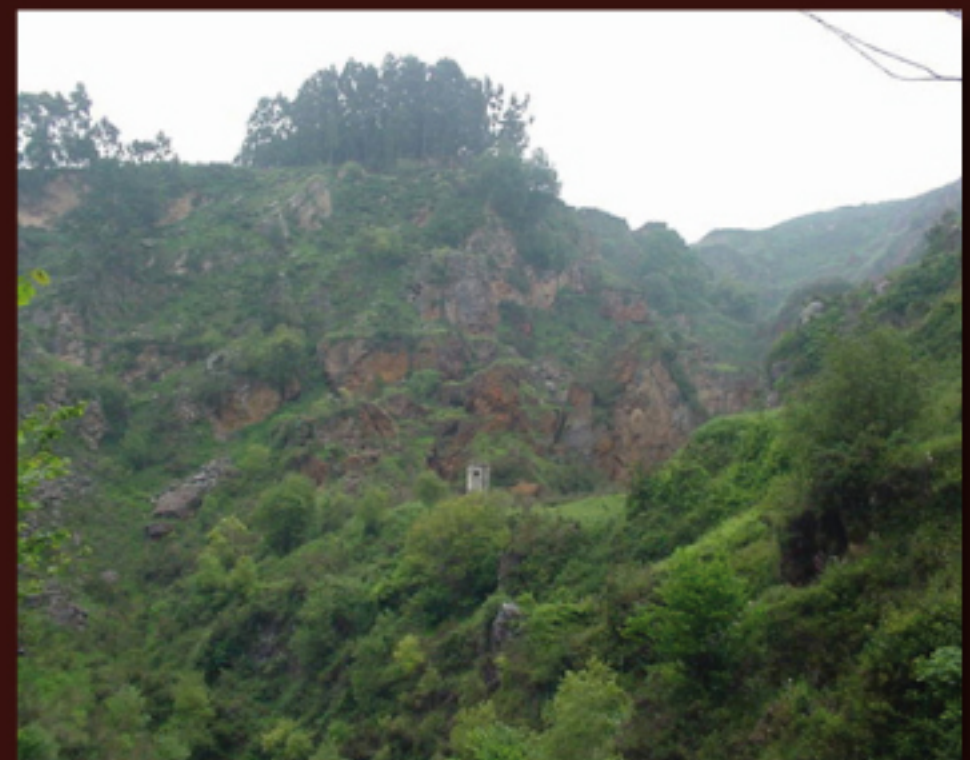
Vista de la Mina Ceferina