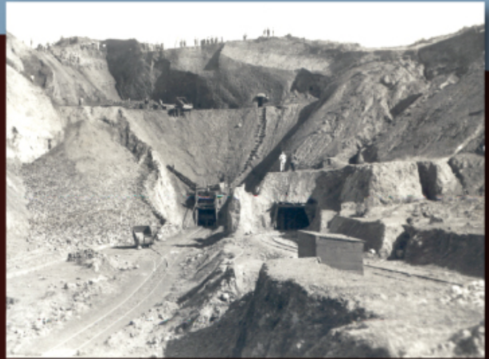
La mina Ceferina en 1910.

Se propone su señalización y acondicionamiento como espacio didáctico, formando parte del itinerario de vías verdes y mineras. Es necesario el estudio geológico del entorno de la explotación. Estudiar la posible apertura de galerías.