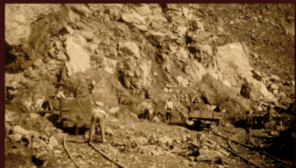
Detalle de la explotación minera de La Ceferina, a principios del siglo XX, en la que se puede observar a los mineros realizando las tareas de arranque y transporte del mineral.