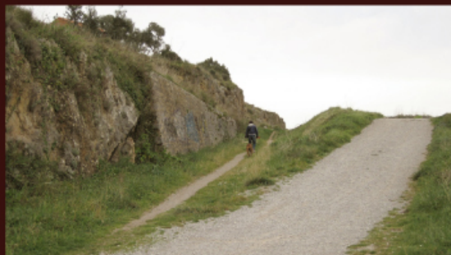
Trincheras de ferrocarril próxima a los cargaderos de Urdiales.