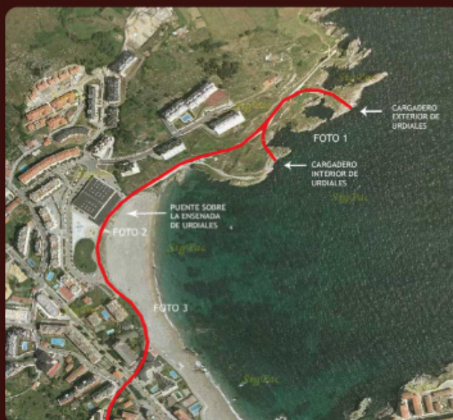
Esquema de la línea de ferrocarril y carga de mineral en Urdiales.