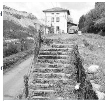
Imagen de una de las estaciones / N.F.

El Ayuntamiento de Castro Urdiales pretende recuperar los terrenos ocupados por el trazado del viejo ferrocarril minero que le han sido usurpados por constructores y particulares en los últimos años. Para ello solicitó hace unos meses un informe jurídico que determinase qué terrenos del antiguo trazado del ferrocarril minero Castro-Traslaviña y Castro-Alen le han sido usurpados al patrimonio municipal. El documento, redactado por el gabinete jurídico Gómez-Cabezuelo ya ha sido remitido al Consistorio e incluye un análisis sobre las soluciones jurídicas para recuperar las propiedades municipales.